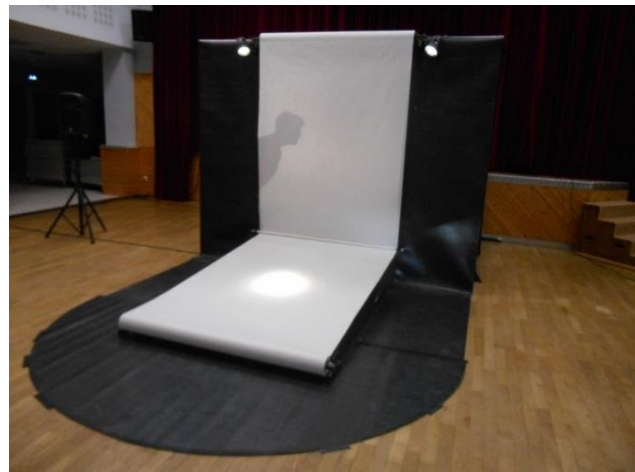
MACHINE A JOUER VUE DE FACE