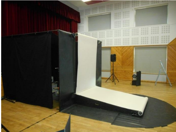
MACHINE A JOUER VUE DE COTE